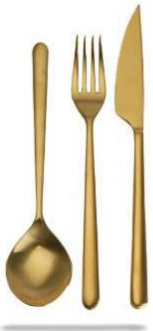
LINEA ICE ORO