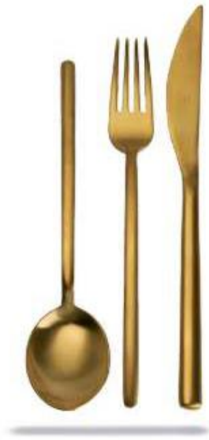
DUE ICE ORO