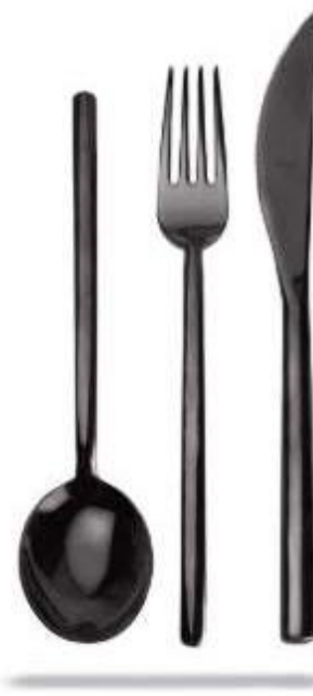
DUE ORO NERO