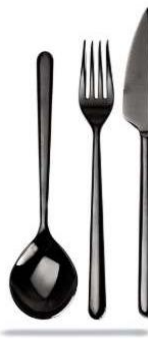
LINEA ORO NERO